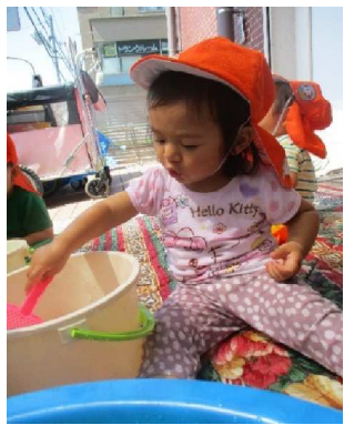
♡水遊び(ちゅうりっぷ組)