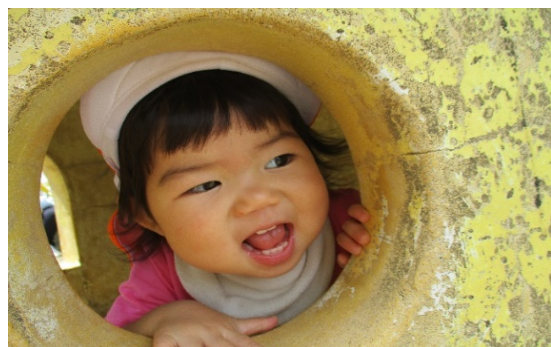
ちゅうりっぷ（1歳児）

お外が大好きなちゅうりっぷ組さんです。 いないいないばあっ！笑顔がかわいいですね。