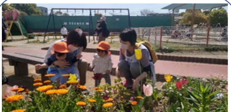
ちゅうりっぷ組さん(1歳児)は、きれいなお花を見つけてニコニコ楽しそうですね(*^-^*)