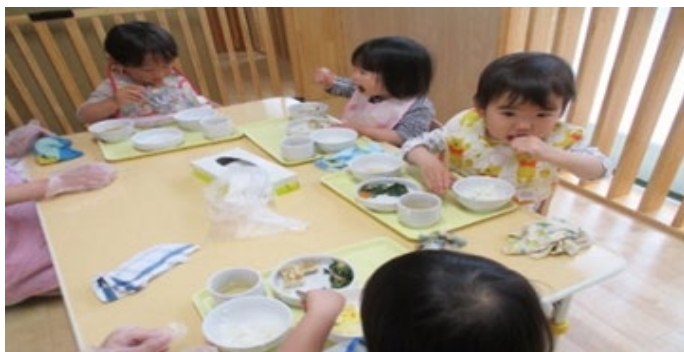
さくら組さん(2歳児)は、お散歩でたくさん歩いて、たくさん遊んで、食欲旺盛です(*^^)v